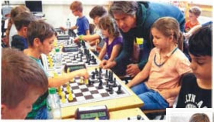
Lönsbergsschule gewinnt auf Anhieb die Essener

Am Ende einer wechselhaften Spielzeit sorgt die U14-Mannschaft der Sportfreunde Katernberg für einen verständlichen Abschluss: Bei der